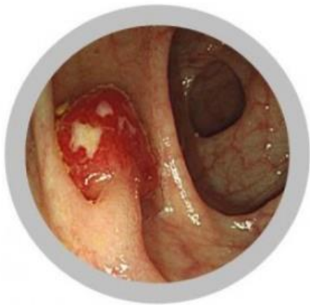
大腸ポリープ(1p型) 内視鏡的切除が可能