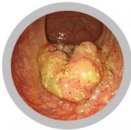
大腸癌(2型) 手術が必要